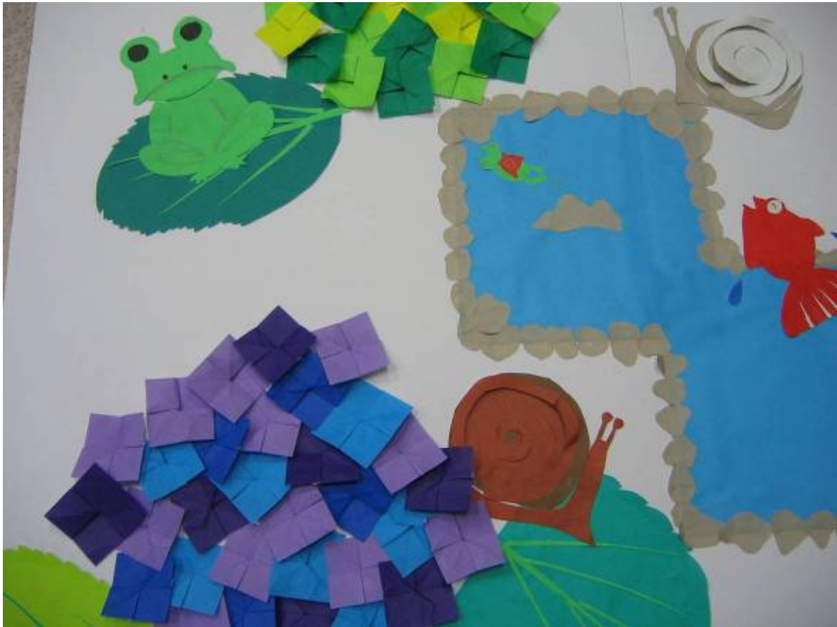
利用者による「おりがみ作品」