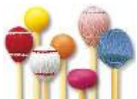
素材・硬さ・形も様々なマリмба用マレット