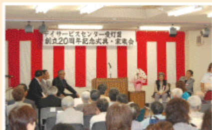
ラ〜ヘ〜ラ〜♪ カメラに向かってイエイ！

デイサービスも今年でなんと20年、昔のデイサービスの思い出もたくさんあり、懐かしている職員、利用者の姿がありました。これからも皆さんと一緒にたくさん良い思い出を作っていきたいですね。