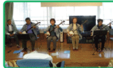
三味線演奏 ○○○の会の皆様