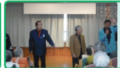
幸せの青い鳥 の皆様