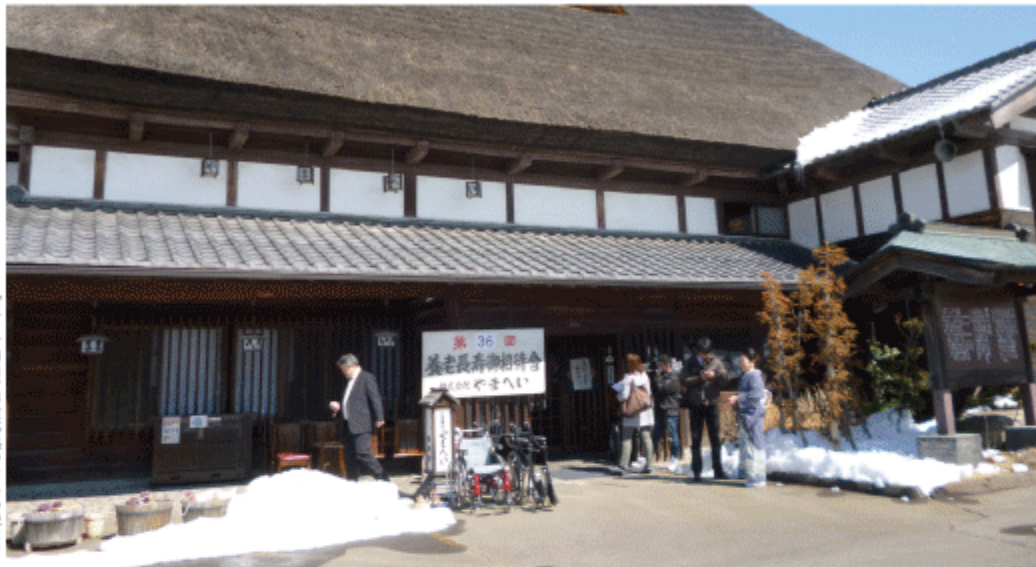
三月十四日、お食事処やまへい様にて

社会福祉法人 愛灯園 〒384-0805 長野県小諸市宇高峯己1番地 TEL.0267-22-8177 FAX.0267-25-2233