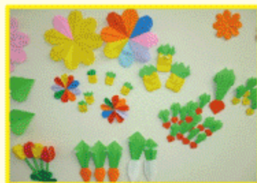
折り紙で作った野菜や花々です♪