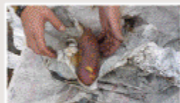
あちっっ！ホクホクだね^^

たくさんのお菓子を集め、モクモクと煙を出しながら今年も焼き芋大会を行いました。「昔はよくこういしたもんだ」「ゆっくら焼やさないよ」たくさんのお声かけ合いながら、できたての焼き芋をおやつで頂きました。