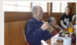
いやー、楽しいねー！