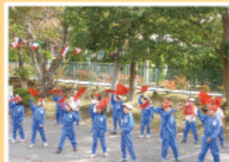
とってもカッコイイ演舞でした♪