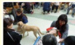
皆さんにご紹介です♪

ハローアニマルさんのご協力により、動物とのふれあいの場を、今回も設けることが出来ました。元気な犬達や可愛いウサギをなでていると、なんだがとっても心が癒されますよ。