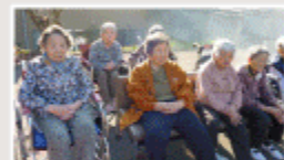
はやく焼けないかな～♪