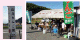
秋晴れで気持ちよかったです

秋の味覚「りんご」、甘酸っぱくて美味しいりんごを食べに、長井りんご園へりんご狩りに行って来ました。次々にりんごを口にほおぼり、満面の笑顔。美味しい物を食べると、表情も幸せな顔になりますよ。