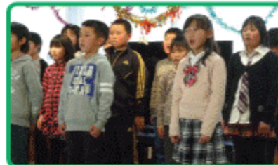
坂の上小学校 四年一組の児童