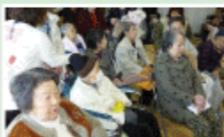
なにが始まるのかしら！？

利用者の皆さんが手縫いで作った様々な作品を展示させて頂き、たくさんのお出し物やお店を見て頂きました。毎年開催されているので、来年は皆さんも是非訪れてみて下さい。