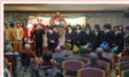
みんなでメリークリスマス！