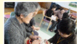
暖かい体しているね