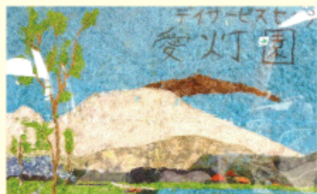
ふれあい祭り出展「初春の浅間山」利用者共同作品

A3用紙の4倍、A2の台紙(594mm×420mm)に少しずつ、少しずつ、たくさんの利用者の皆さん達が協力して作り上げた大作です。 普段は、小さな台紙にちぎり絵を作るのですが、大きさに気後れしてしまいう時もあり、作成を始めた頃は「いつ完成するんだろうねー」などと苦笑いしていた時も。ですが形になっていくに連れ、「やってよかった」「きれいだねえ」と皆で完成を喜び合う事ができました。現在は、愛灯園2階食堂に飾ってあります。実物も是非見に来て下さい。