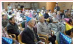
はやく始まらないかな^^

今年も芦原中学校生徒会の皆さんが来て下さいました。合唱部の歌声に感奮させて涙を流す利用者もいたり、紙芝居や、サンタクロースの登場なども盛り上がりました！