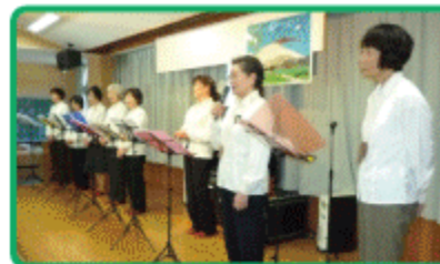
国際ソロプチミストの皆様