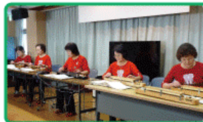
大正琴演奏の皆様

掲載させて頂いた方々の他にもたくさんの方に訪問して頂きました！忙しい中、愛灯園に訪れて頂いた皆様にあたためてお礼申し上げます。