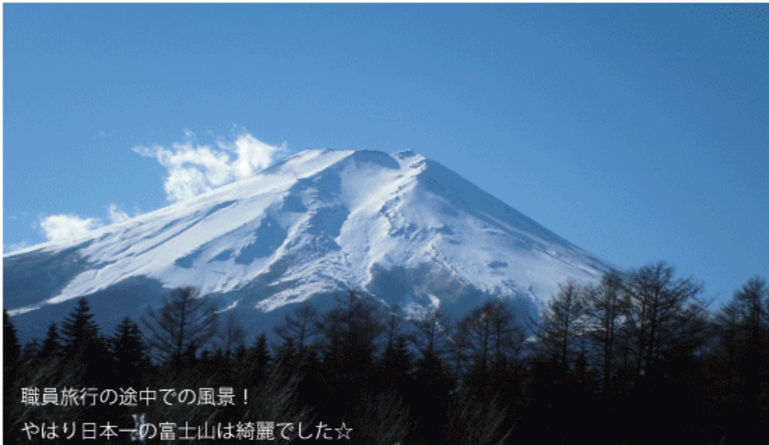
職員旅行の途中での風景！

社会福祉法人 愛灯園 〒384-0805 長野県小諸市字高峯己1番地 TEL.0267-22-8177 FAX.0267-25-2233