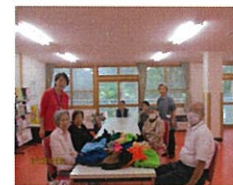
打ち立てのお蕎麦おいしかったです