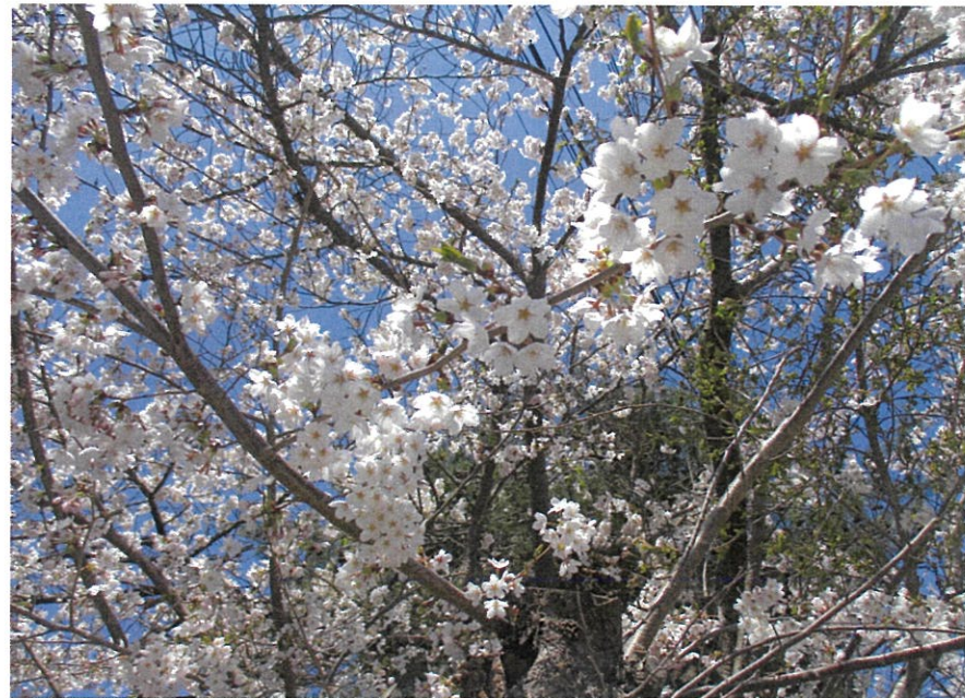
愛灯園前の桜の蕾も青空に向かって咲いてきました！！

新型コロナウイルス感染症の収束の目途が立たないまま、新年度を迎える事となりました。今年度も引き続き利用者様を守るべく、職員一同、日々変化する状況にスピード感を保持して的確に対応して参ります。法人として、最重要課題は『介護人材の確保』が挙げられます。将来、少子化により、生産年齢人口は社会全体で減少することが予想されますが、安定的な経営の継続に介護人材は、必要不可欠であります。そのためには、現在在籍している職員の処遇改善・福利厚生の実施など、離職防止を図るとともに、新規職員の採用に向けて求人活動の充実を図って参ります。 最後にコロナウイルス感染症や、想定外の大規模災害の発生など、介護施設を取り巻く状況に重大な危機感を感じております。また、二〇二四年までに、策定義務がある事業継続計画（BCP）を作成しなければなりません。そのためには、地域住民との連携、災害時の設備の改修・見直しなど問題は山積しておりますが、全職員が一丸となって計画的に取り組んで参ります。