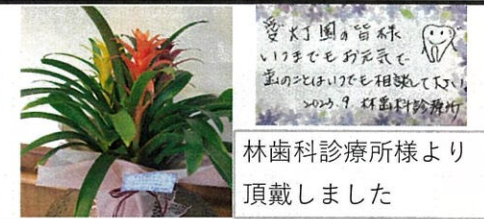
林歯科診療所様より 頂戴しました