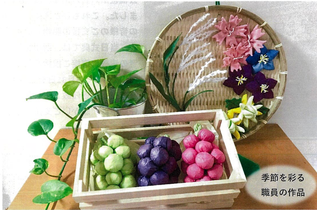
季節を彩る 職員の作品