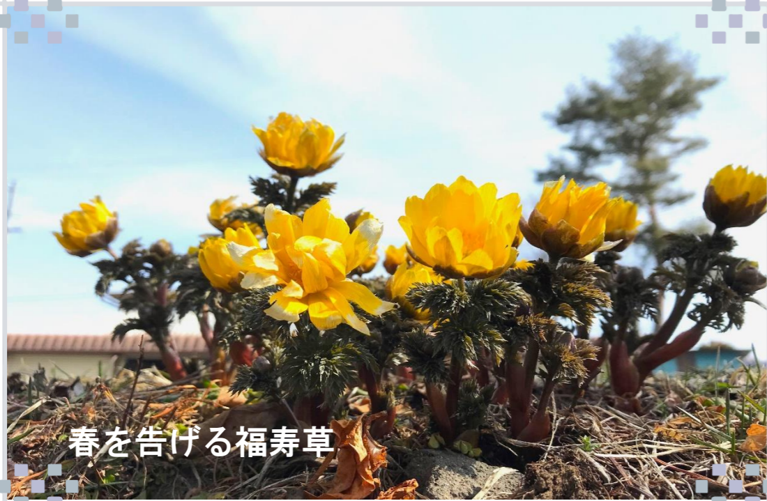
春を告げる福寿草

新年度、また桜の花が舞うこの季節を職員一同、心持ちで迎える事が出来ました。皆様におかれましては、社会福祉法人 愛灯園の運営に対し、ご理解ご協力いただきまして御礼申し上げます。また、元旦に発生いたしました能登半島地震に引き続き、被災をされた皆様にお見舞いを申し上げます。私共も、物的・人的支援を行ってまいりたいと考えております。継続的な支援を行ってまいりたいと考えております。小諸市より福祉避難所の指定を受けておりますが、あれほどの大規模災害が発生した場合、機能不全に陥ってしまうことも想定されます。しかしながら、施設利用者様・職員の安全は基より、地域の要介護者の受け入れにも万全を期すとともに、福祉避難所としての役割をしっかりと果たすこと、地域の社会貢献に努めてまいります。四月からは、三年に一度の介護報酬の改定があり、昨今の物価高騰を反映してか若干のプラス改定となっております。しかしながら、楽観することなく物価の動向をしっかりと見極めて、安定的な収入の確保と無駄な支出を抑えることで、しっかりとした経営基盤を維持してまいります。介護報酬がプラス改定ということは、ご利用者様・ご家族様の利用料の負担も若干増えてしまいうえ、複雑な気持ちでもありません。ですが、今以上に、ご利用者様へのサービス向上にしっかりと転換できます。今年度も様々な課題がありますが、地域の皆様から信頼される施設を目指して、決して慌てることなく、しっかりと腰を据えて取り組んでまいります。