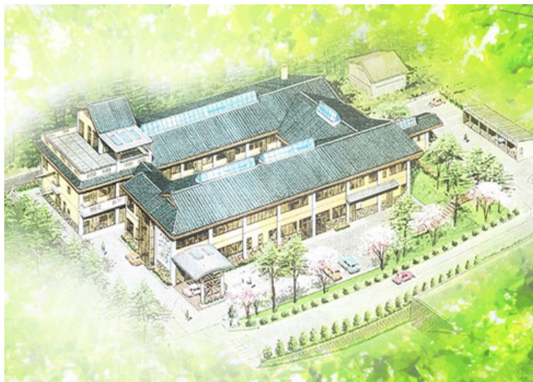
愛灯園イラスト 上空より