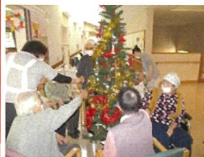
飾り付けもみなさんで！