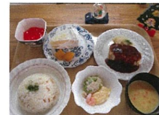
メインディッシュはミートローフ